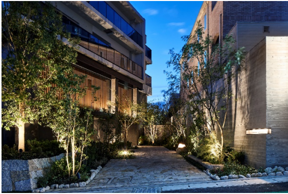
エントランスアプローチ