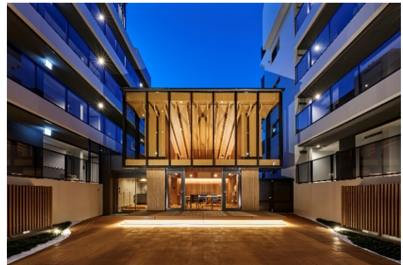
コモンホール・コモンテラス