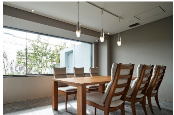
レセプションルーム