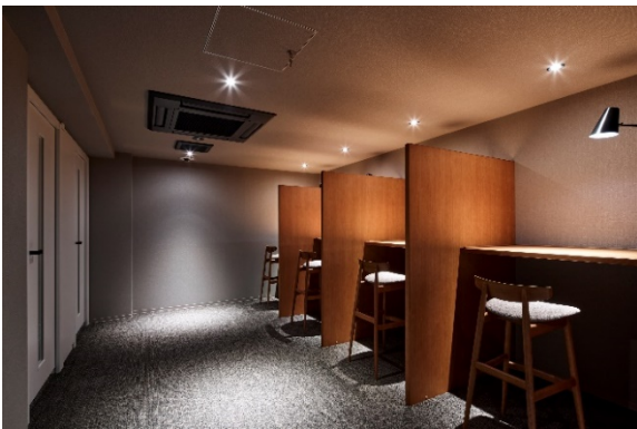
ワーク&スタディールーム