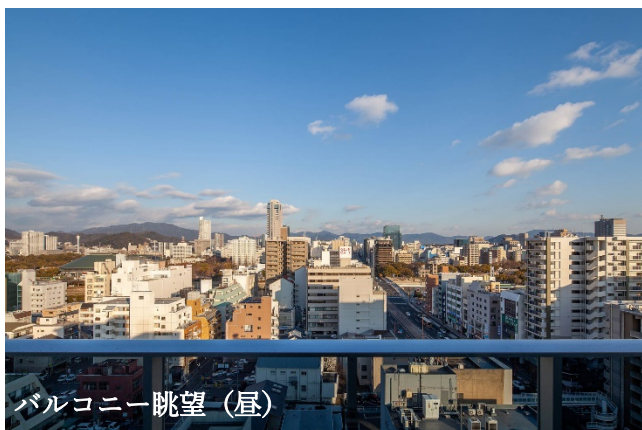
バルコニー眺望 (昼)