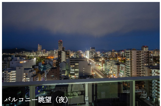
バルコニー眺望 (夜)