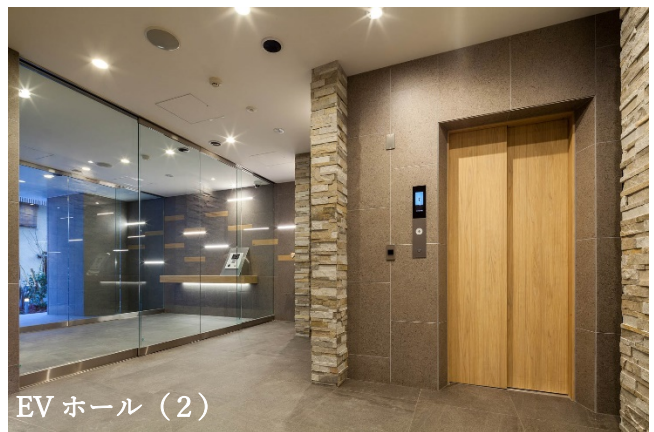
EV ホール (2)