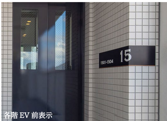
各階 EV 前表示