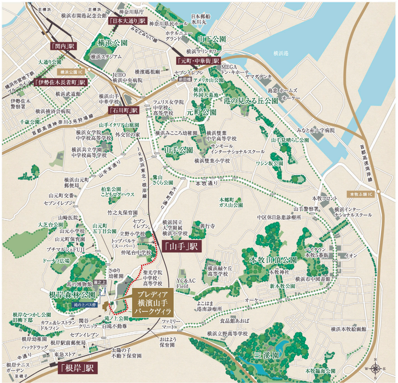
□現地周辺案内図 ●●●● 徒歩ルート