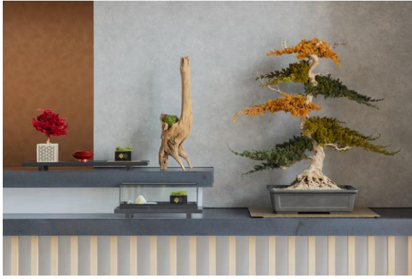
建物内各所に配置されたドライ盆栽