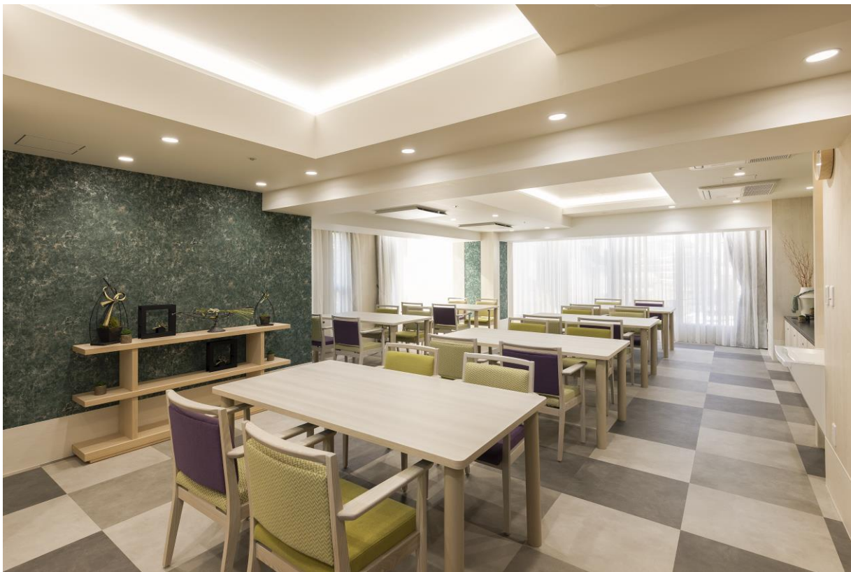
開放感のあるダイニング