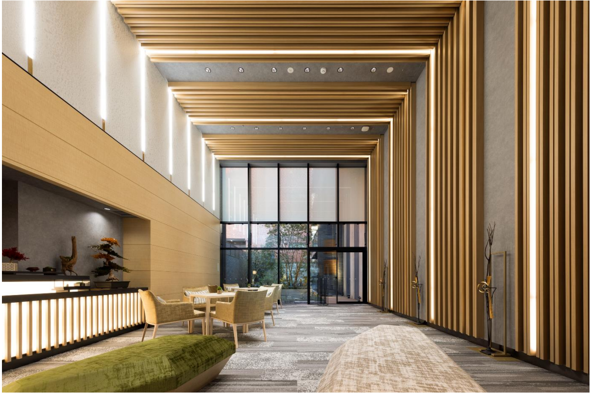
中庭を望む吹き抜けを有するエントランスラウンジ